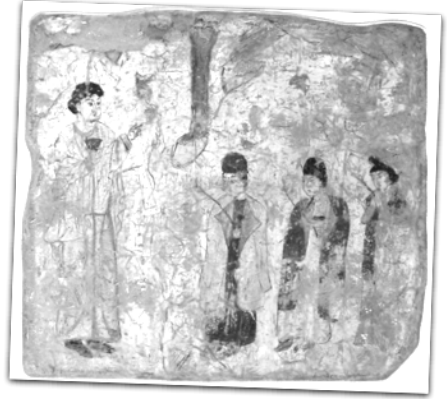
Günümüze ulaşmış bir 6.yüzyıl Nesturî Çin kilisesi kalıntısı ve Çin kilisesinde Palmiye Pazarını kutlanmasını konu alan resim